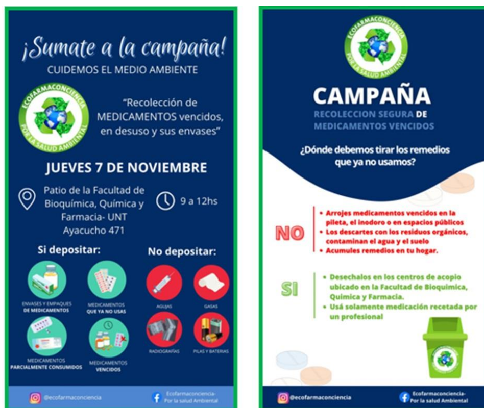
Fig.1. Material de difusión: folletos utilizados en las campañas