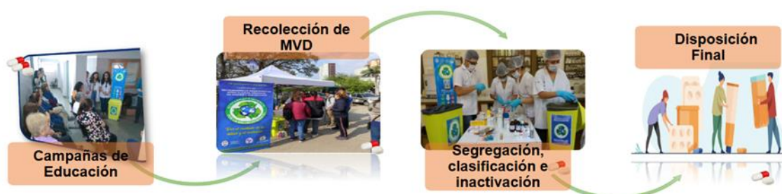
Fig.2. Metodología empleada para la recolección, clasificación, segregación y tratamiento de medicamentos vencidos y/o en desuso de San Miguel de Tucumán.